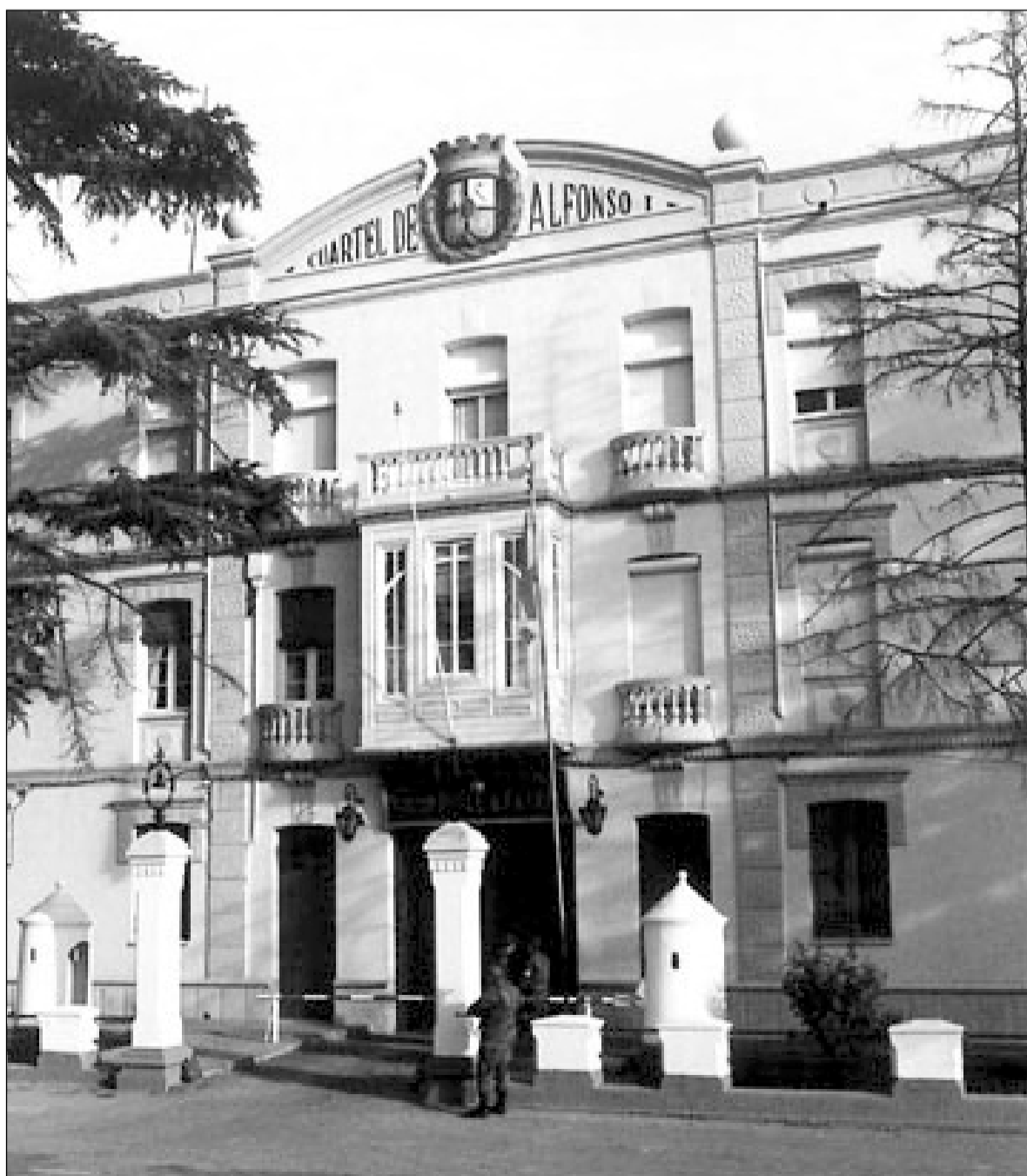
La fotografía del cuartel de Alfonso I es la que ilustra la portada del libro. S.E.

El libro se presenta al público oscense el 2 de octubre, a las 19 horas, en el Instituto de Estudios Altoaragoneses