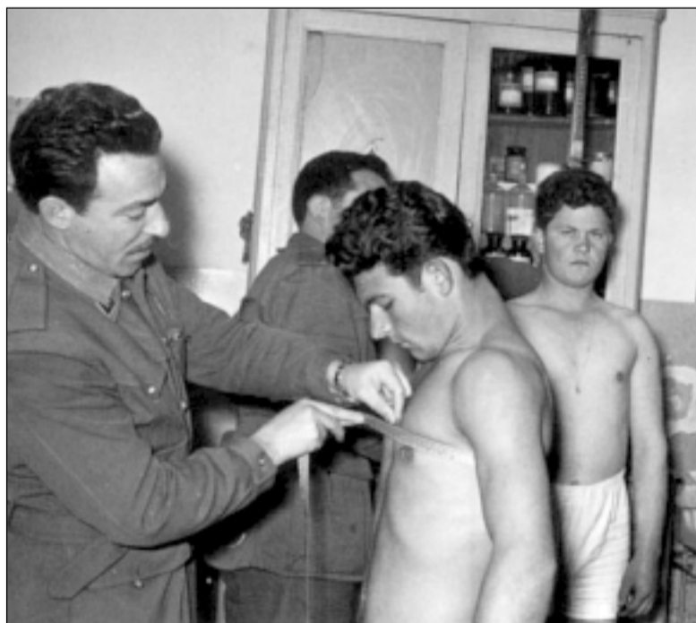
Reconocimiento médico de los reclutas en los años 60. S.E.