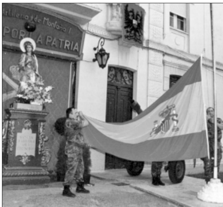
Último arriado de la bandera con la imagen de Santa Bárbara.