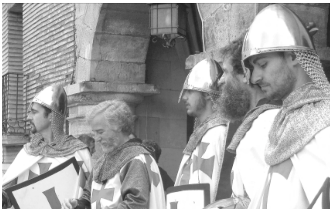
Templarios de Mont-Rodón. F.J.P.