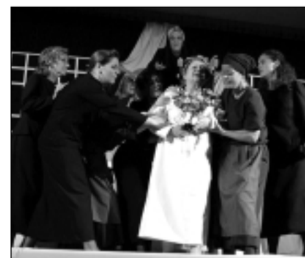
Función del Teatro de Robres. S.E.

El Teatro de Robres clausurará la próxima semana el VIII Festival Internacional de Teatro Aficionado de la localidad santanderina de Torrelavega. El grupo altoaragonés llevará "La casa de Bernarda Alba" al Teatro Municipal "Concha Espina", donde actuará a las 20.30 horas el sábado 22. A este certamen se presentaron 120 propuestas diferentes y un jurado especial, nombrado por el ayuntamiento de la localidad, seleccionó a 10 compañías para que participaran en el festival. Entre ellas estaba también la Agrupación Teatral de Sabiñánigo, que mostró la obra "Las manos" la pasada semana. El Tea-