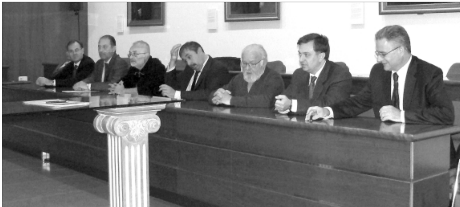
En la firma del acuerdo estuvieron presentes los representantes de los quince museos aragoneses.